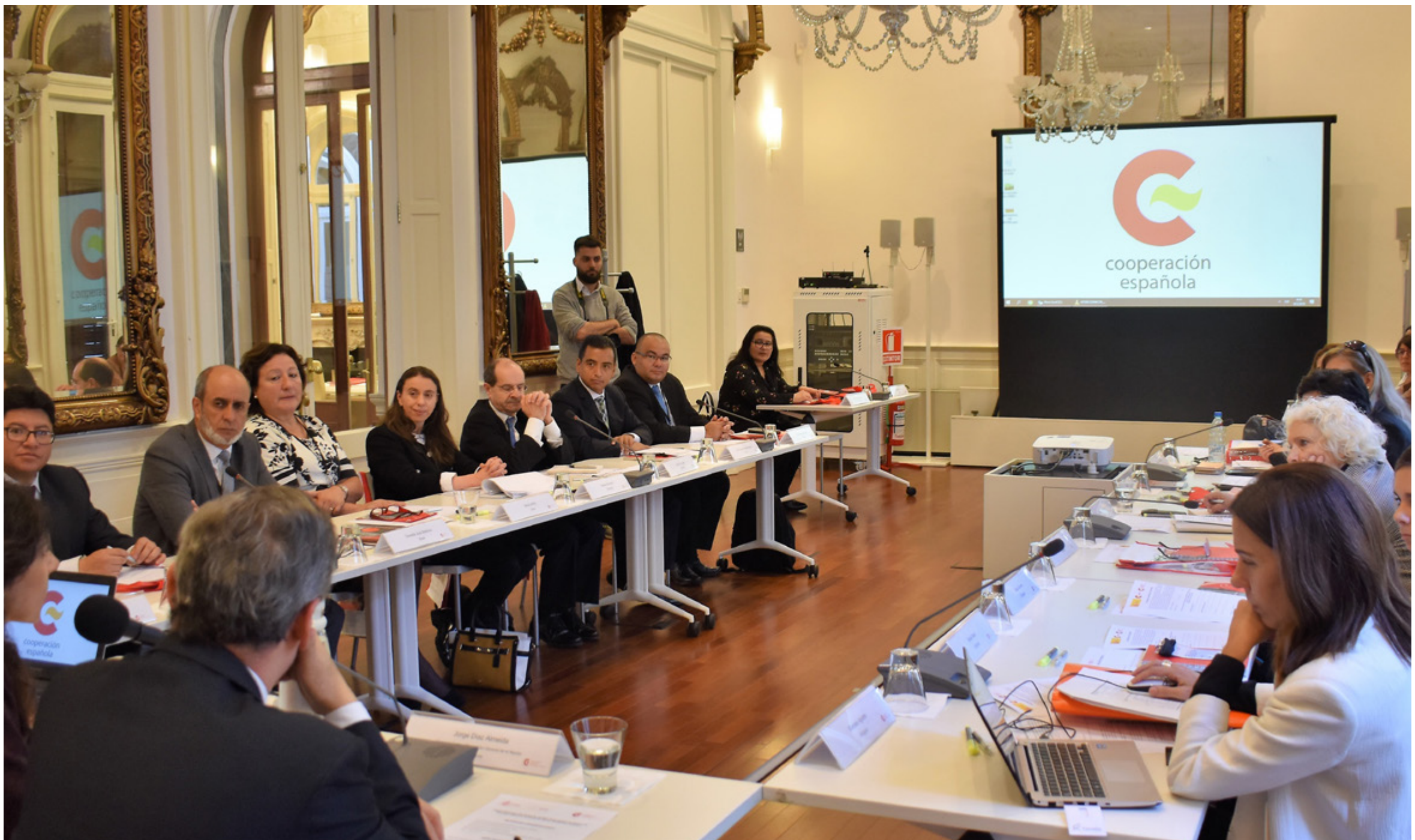
Representantes de 14 Ministerios Públicos participaron en la elaboración de la Carta de Principios Éticos de la AIAMP, la que busca dotar a los fiscales de una guía que oriente su actuación desde una perspectiva transversal de Derechos Humanos y de género.

Y añade que las conclusiones a las que llegaron reforzaron que se necesitaba un marco sobre el que actuar, “porque en el último tiempo ha existido cierto deterioro en la confianza en los sistemas de justicia”.